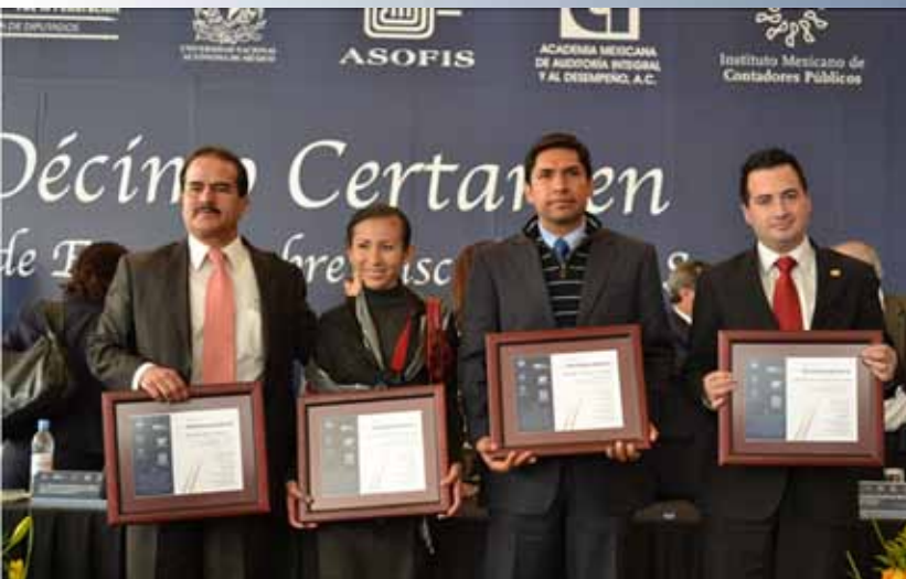
Los ganadores del certamen mostrando sus diplomas

manera, los problemas y debilidades estructurales de la economía nacional y de la gestión pública.