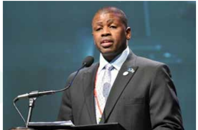
Terence Nombembe, Auditor General de Sudáfrica

La Auditoría General tiene un mandato constitucional y, como Entidad Fiscalizadora Superior de Sudáfrica, existe para fortalecer la democracia del país al posibilitar la supervisión, rendición de cuentas y gobernanza en el sector público, a través de la práctica de auditorías, construyendo así la confianza pública.